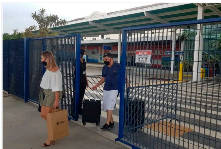
Desembarque é realizado de forma escalonada.

Após dezenas de casos de covid-19 registrados ao longo desta semana, o cruzeiro marítimo do MSC Splendida foi cancelado nesta sexta-feira (31), quando houve o início do desembarque de passageiros de forma escalonada no Porto de Santos. O restante dos hóspedes deixou o navio neste sábado (1º). Vale lembrar que todas as pessoas que testaram positivo para a doença e quem teve contato próximo com infectados deixaram o navio na quinta-feira (30).