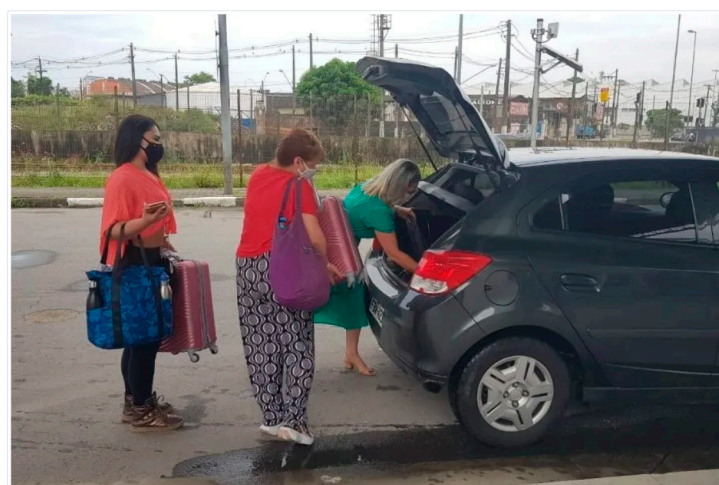
O cancelamento do cruzeiro foi anunciado aos hóspedes na sexta-feira (31).

Nesta sexta-feira (31), a agência recomendou ao Ministério de Saúde a suspensão da temporada de cruzeiros no País. A pasta, em nota, informou que tomou conhecimento da recomendação e avaliará as medidas cabíveis em conjunto com os demais ministérios relacionados ao tema.